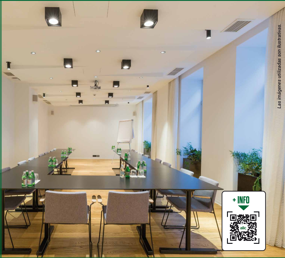
Las imágenes utilizadas son ilustrativas.