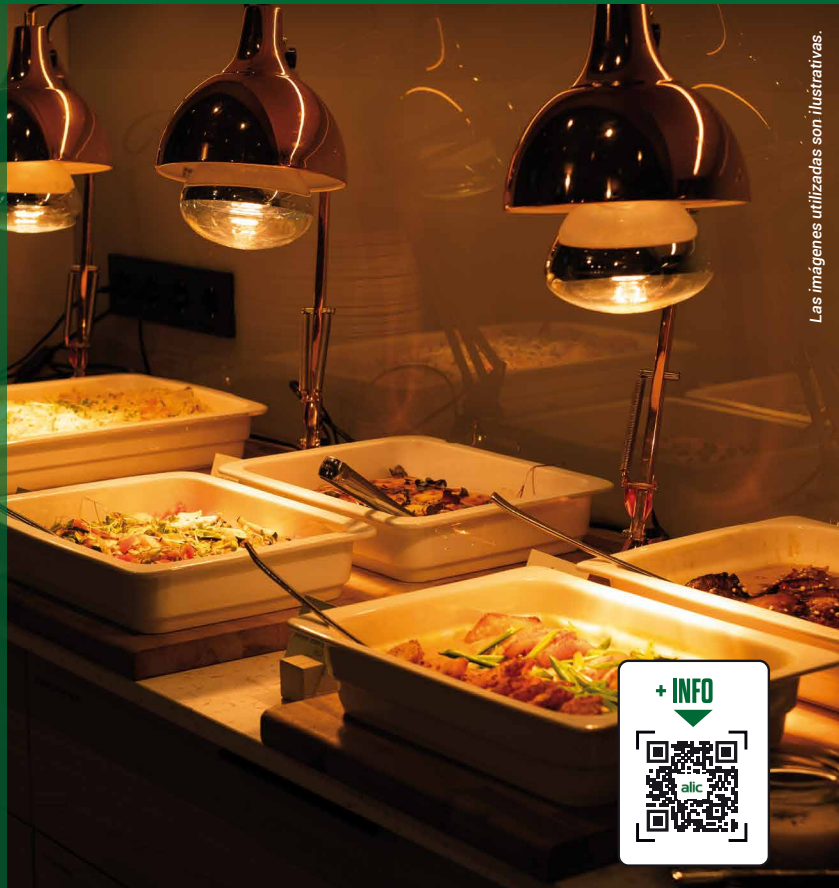
Las imágenes utilizadas son ilustrativas.