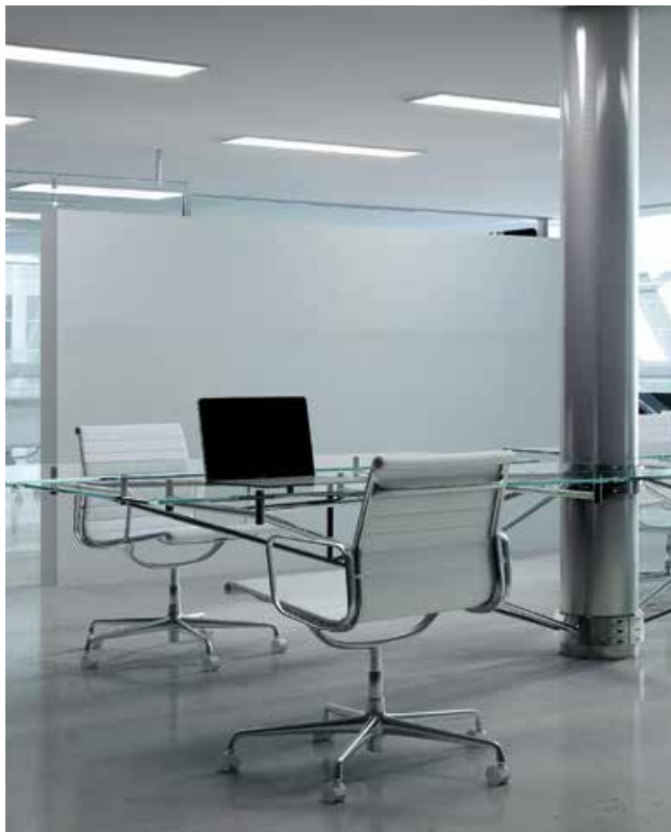
Las imágenes utilizadas son ilustrativas.