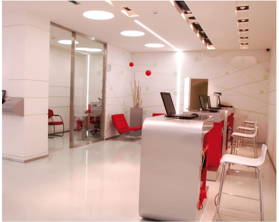
Las imágenes utilizadas son ilustrativas.