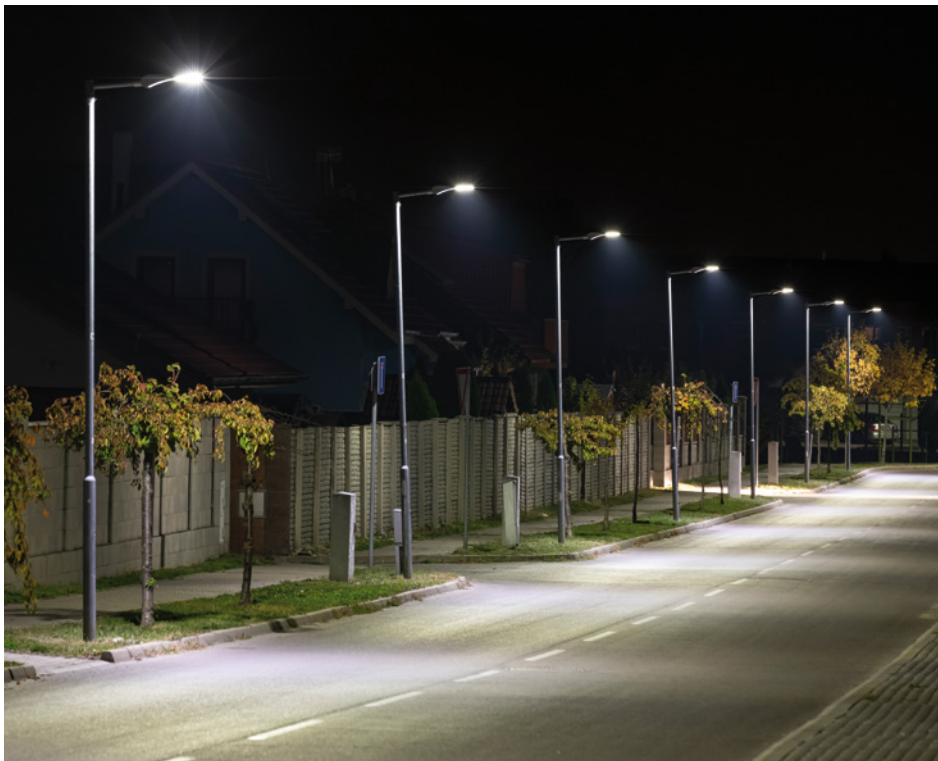
Las imágenes utilizadas son ilustrativas.