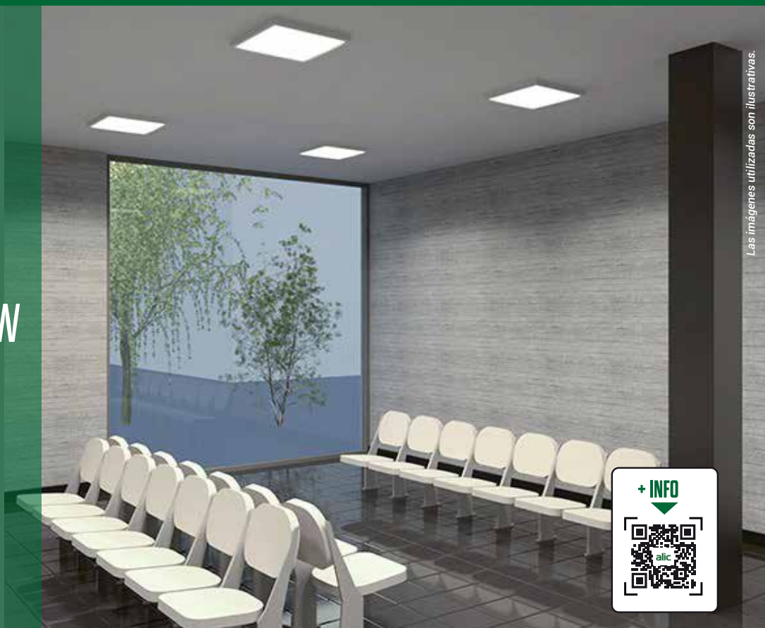
Las imágenes utilizadas son ilustrativas.