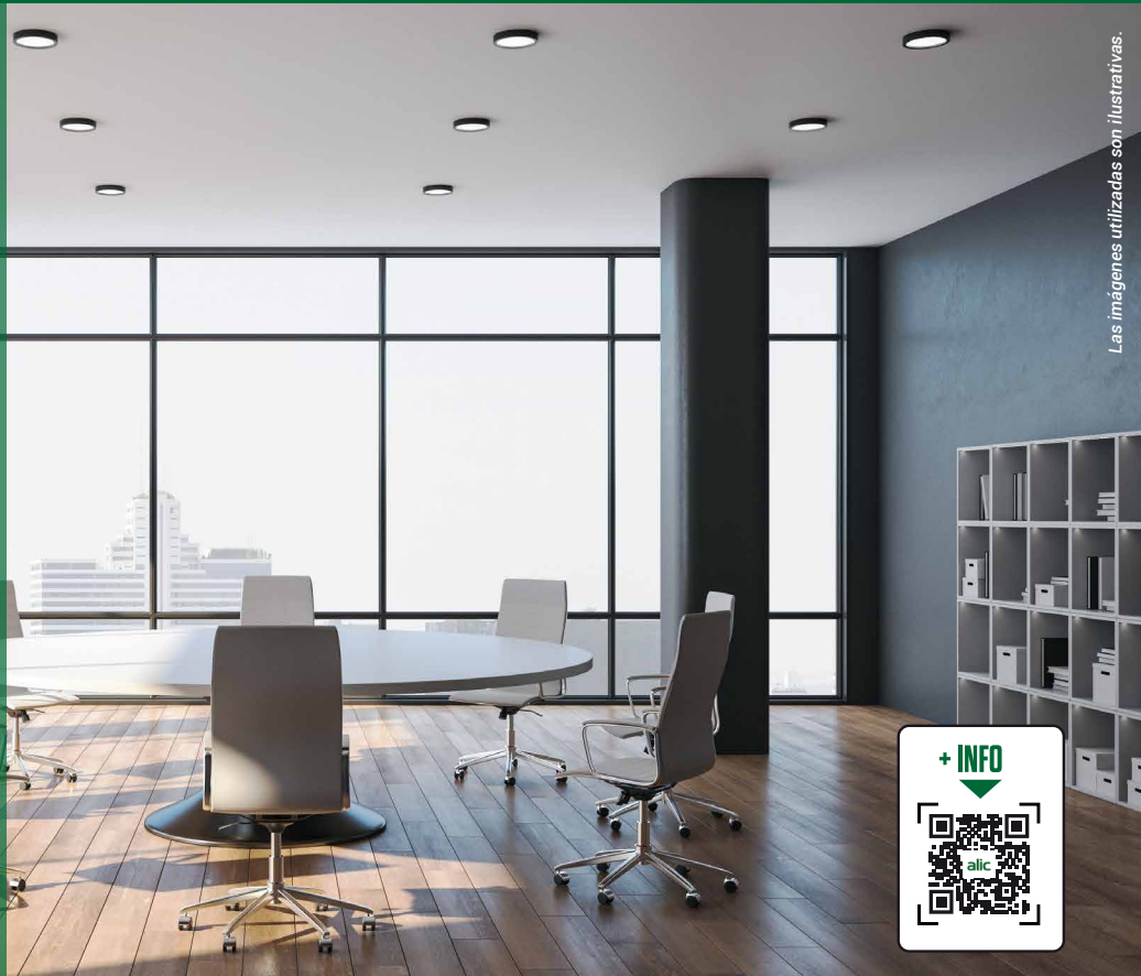
Las imágenes utilizadas son ilustrativas.