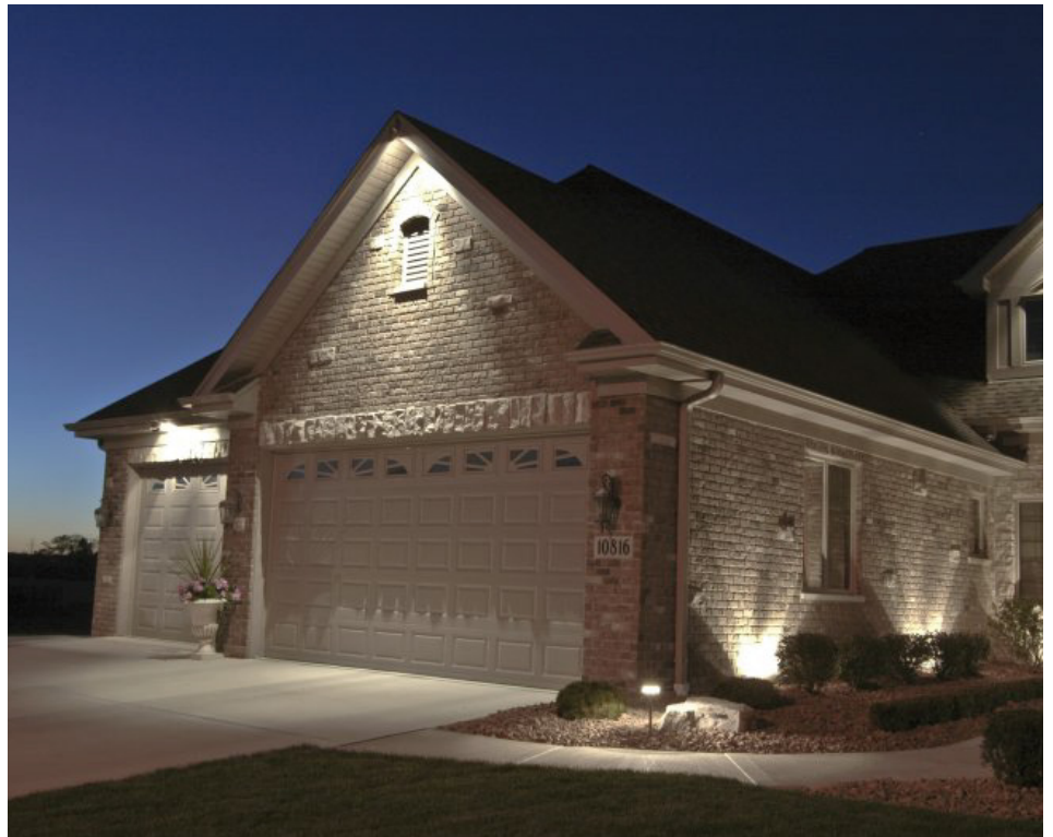
Las imágenes utilizadas son ilustrativas.