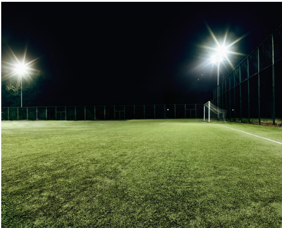
Las imágenes utilizadas son ilustrativas.